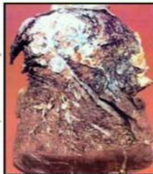
Больная ткань легкого