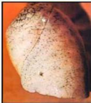
Здоровая ткань легкого